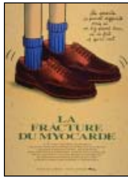
Les affiches du film