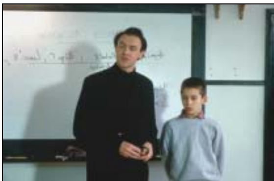
Le professeur d'histoire et Martin Gaudinier

Martin, 12 ans, habite une petite maison très modeste avec sa mère qui travaille dur et n'a pas beaucoup de temps pour s'occuper de lui. Elle fait des ménages chez les gens. Martin n'a jamais vu son père. Il ne connaît pas son nom. Sa mère n'a jamais voulu lui parler de lui. Quand elle meurt, il se retrouve tout seul, sans famille.